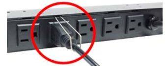
Anti-shedding power plug hook